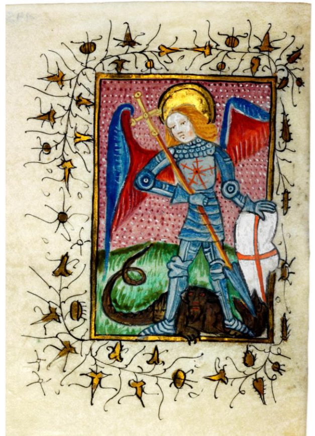
Michael en de draak, uit het Getijdenboek van Reynegom (c. 1425-1435)