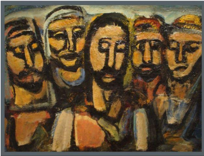
Georges Rouault: Christus en de apostelen, 1937-1938 olieverf op doek, 63.5 x 99.1 cm.

Rouault is een van de grote Franse kunstenaars van de eerste helft van de 20ste eeuw. Hij is ook een van de weinige christelijke meesters van zijn tijd. Zijn dik gelijnde stijl, die zijn basis in het maken van glas-in-loodramen verraadt, maakt zijn werk makkelijk herkenbaar. Op dit schilderij uit 1937/38 heeft Rouault de vijf mannen dicht naast elkaar gezet. Jezus staat voorop, kwetsbaar, de ogen neergeslagen. Pal achter hem staan de apostelen, twee aan twee.