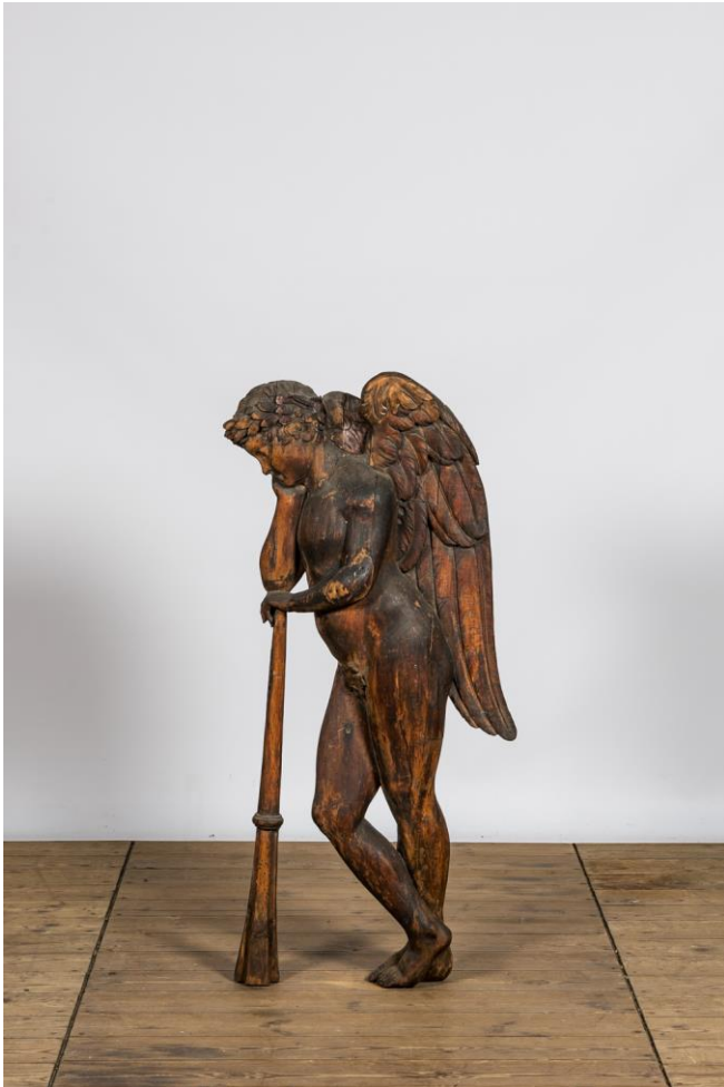
Engel, rustend op z'n trompet, hout, 18 e eeuw