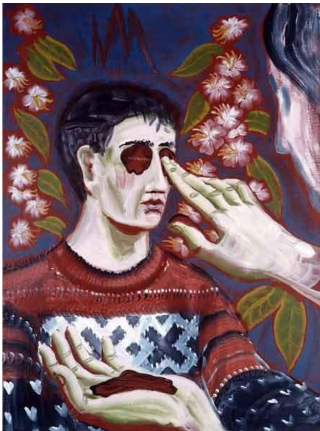
Gijs Frieling: Genezing van een blinde, 1999.

'In het voorbijgaan zag Jezus iemand die al vanaf zijn geboorte blind was.' Joh. 9, 1-2