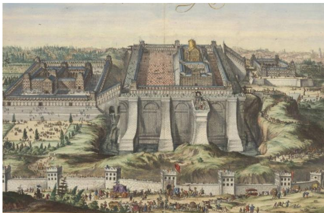
De tempel van Salomo, prent ingekleurd door Dirk Jansz van Santen c. 1697

Komende zondagen geeft het oecumenisch leesrooster de mogelijkheid om de verhalen van koning Salomo in 1 Koningen te lezen. Koning Salomo bouwt een huis voor de Eeuwige. Maar zou God werkelijk op aarde kunnen wonen? Er is dan ook drempelvrees, kan dit huis wel een huis voor God zijn? Zoals ook alle liturgie met drempelvrees begint, met toenadering en toewijding.