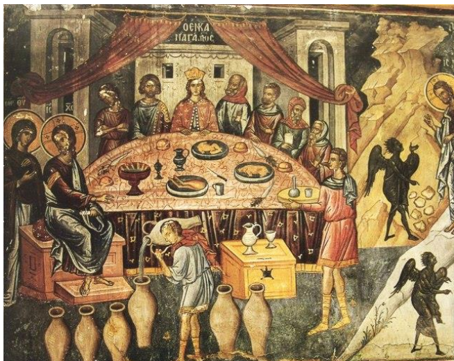
De Bruiloft in Kana, fresco uit 1527 in het klooster van St. Nikolaas Anapausas, Meteora (Griekenland)