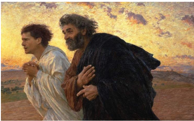
Eugène Burnand (1850 – 1921), Johannes en Petrus rennend naar het graf op de morgen van de opstanding , olieverf op doek, 83 x 135 cm. Musée d'Orsay, Parijs.

Het is het bekendste werk van Burnand. De Franse staat kocht het meteen toen het getoond werd op de Salon de la Société Nationale des Beaux-Arts in 1898. Johannes rent voorop, een intense mengeling uitstralend van hoop, verlangen en angst dat het toch niet waar zal blijken te zijn. Iets lijkt Petrus terug te houden. Moet er nog iets worden uitgesproken? Als één van de betekenissen van Pasen is, dat relaties worden hersteld, dan kan dat ons vandaag ook inspireren en richting wijzen. Pasen is Gods helende macht, de kracht van de verbinding, de kracht die relaties herstelt, over grenzen heen die voor ons ondoordringbaar zijn, of waarvan wij denken dat ze dat zijn.