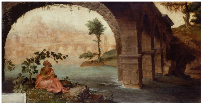
'Jonah Under His Gourd' van schilder Maarten van Heemskerck (1498–1574) opgenomen in de Royal Collection UK