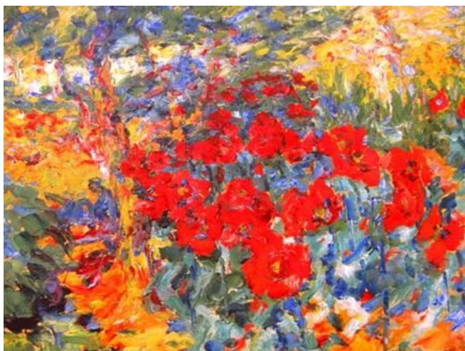
Zomer bij Nolde

Vanaf 1906 werd de Duitse expressionistische schilder Emil Nolde (1867-1956) lid van de kunstenaarsgroep Die Brücke. Hiermee begon een intensieve fase in zijn werk. Ook zijn eerste bloemenschilderijen ontstonden vanaf die tijd. In het plaatsje Alsen op het Deense platteland, waar Nolde samen met zijn vrouw Ada een vissershuisje bewoonde, werd hij geïnspireerd door de bloeiende planten in zijn eigen tuin. In zijn biografie zegt Nolde over de start van deze reeks: 'De kleuren van de bloemen trokken me onweerstaanbaar aan, en ineens stond ik daar te schilderen. De kleuren van de bloeiende bloemen, de zuiverheid van de kleuren: ik voelde liefde voor de bloemen om hun levenslot: ontkiemen, bloeien, stralen, verwelken en weggegooid in een kuil' (Jaren van strijd, blz. 100). Ook in latere jaren bleven tuinen en bloemen een centraal thema in Noldes oeuvre. Overal waar hij zich langere tijd vestigde legde hij bloementuinen aan.