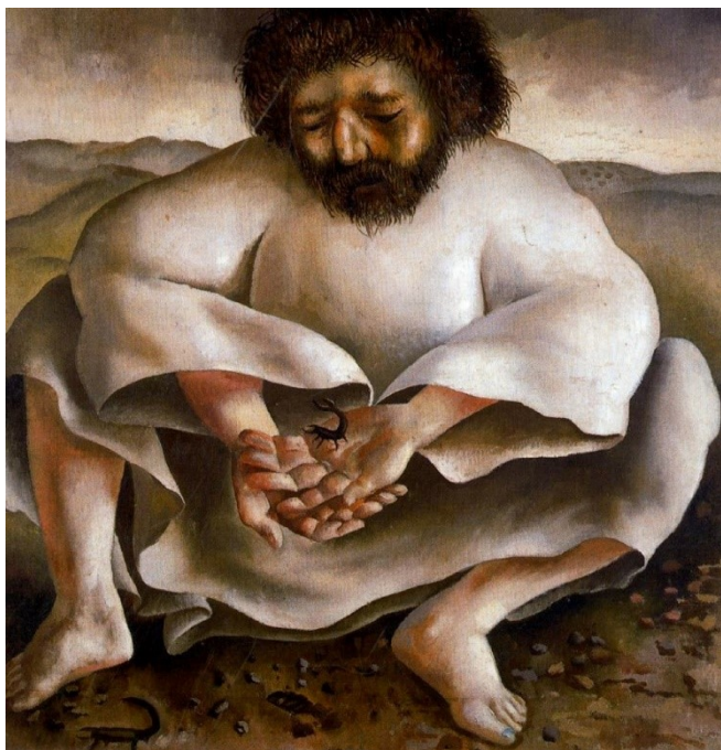
Stanley Spencer (1891-1959), 'Christ in the Wilderness – The scorpion'

'Hij beschermt en bewaart mij ik zal niet gestoken worden'. De taal van een gelovige die doolt en dwaalt in de woestijn zijn goede moed op de proef gesteld aangevochten in zijn eenzaamheid Hij wil zich door de wereld heen geloven.