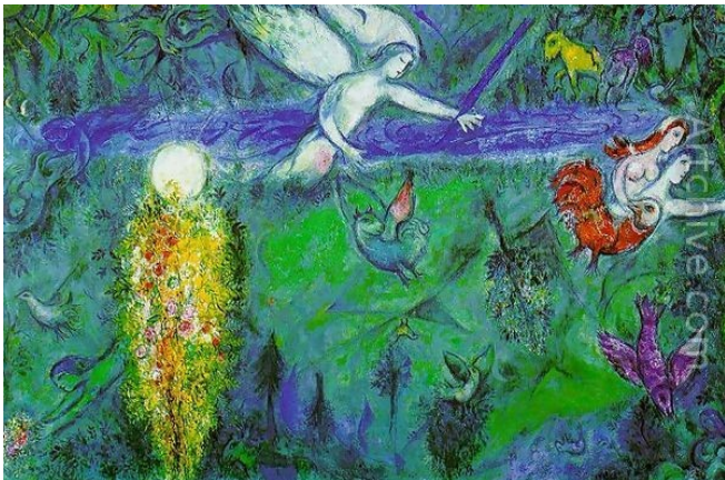
Marc Chagall, Adam en Eva uit het paradijs verdreven (1967)